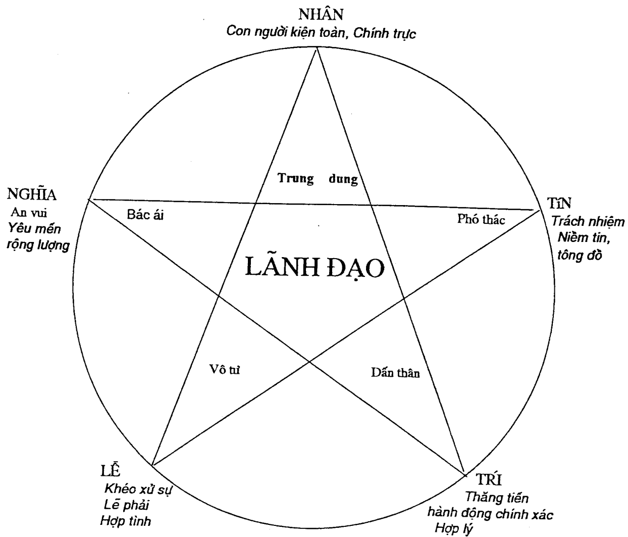
Ngũ Thường (5 mối Lãnh Đạo)